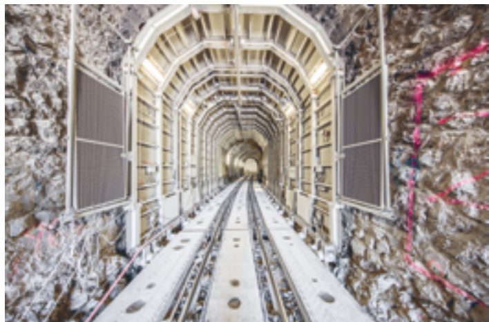
Glatscherastunnel auf der Albulaline. Standardbauweise mit Schutzgerüst für den Ausbruch.

Dies führt zu klar grösseren Tunnelprofilen, welche auch hier unter Betrieb erstellt werden müssen. Zusammengefasst hiess die Aufgabe für die RhB also, dass man einen neuen, grösseren Tunnel im alten Tunnel erstellen musste und dies unter Betrieb. Die RhB hat sich auch dieser Herausforderung gestellt und konnte dank der grossen Unterstützung von vielen Bauunternehmungen eine neue Baume- thode entwickeln. In einem ersten Schritt hat man zu Versuchszwecken im Stollen Hagerbach (zwischen Sargans und Walenstadt) einen RhB-Tunnel im Originalmassstab und mit allen Bahninfrastruktur-Anlagen (Gleis- und Fahrleitungsanlage) nachgebaut. So hatte man die Möglichkeit, unter realen Bedingungen zu testen, welchen Bewegungsspielraum man effektiv im Tunnel hat und welche Geräte dazu über- haupt verwendet werden können.