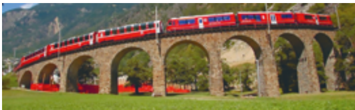
Kreisviadukt Brusio