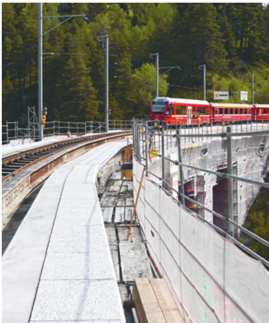
Erneuerung Schmittnertobelviadukt, Alvaneu - Filisur, 2020