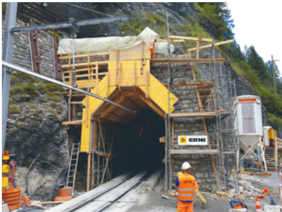
Neubau Portal Gletscherastunnel, Bergün, 2016

Oberste Priorität während des gesamten Baus hat die Sicherheit der Bauarbeiter – und im Falle des Bahnbaus auch jene der Bahnpassagiere und des Bahnpersonals. Deshalb ist es wichtig, dass die Planung sämtlicher sicherheitsrelevanter Aspekte in der AVOR detailgenau geplant sein will. Im Gebirge kommt hierbei noch der Aspekt der erschwerten Zugänglichkeit hinzu. Diese führt zu einer verlängerten Reaktionszeit durch die Rettungskräfte, und zum anderen sind deren Rettungsmöglichkeiten im Gebirge stark eingeschränkt. Auch wenn sich die Kommunikationsnetze in den letzten Jahren stark verbessert haben, gibt es immer noch abgelegene Bauobjekte, in denen kein Mobilfunknetz verfügbar ist.