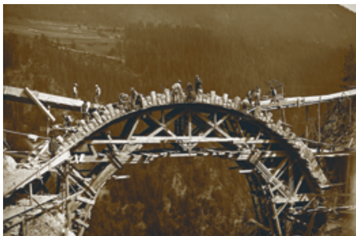
Das präzise Behauen der Steine galt als eine besondere Fertigkeit der Bauarbeiter, 1908