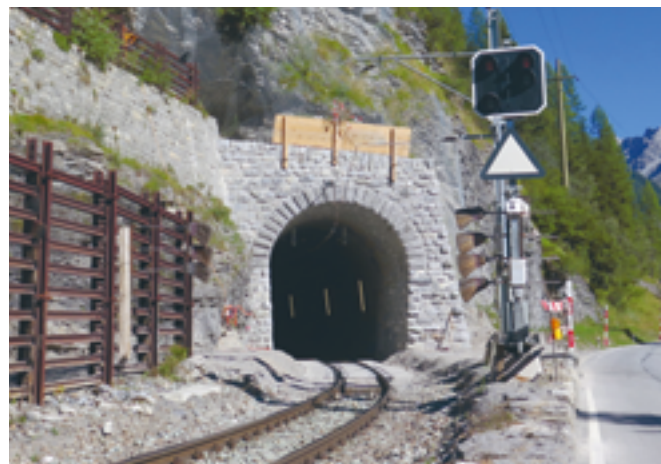
Gletscherastunnel auf der Albulalinie. Vergleich des Portals vor und nach der Erneuerung.

Schnell hat sich gezeigt, dass ein effizientes Arbeiten nur möglich ist, wenn der Ausbruch im Schutz eines Stahlmantels erfolgen kann. Dieser kann einen Teil des ungesicherten Felsens überbrücken und die Verkleidung des Felsens kann mit vorfabrizierten Elementen erfolgen. Gleichzeitig hat man rasch erkannt, dass die Profilaufweitung nur gegen oben funktionieren kann, damit es bei der vertikalen Linieneinführung nicht zu Problemen kommt. Eine wesentliche Optimierung ist der RhB im Jahr 2020 gelungen. Zum ersten Mal war es möglich, bei einem Tunnel die Fahrbahn so auszubilden, dass sie dem Endzustand entsprach und damit keine Langsamfahrstelle während den Bauarbeiten verursachte. Damit ist es gelungen, Fahrzeitverluste für die Regelzüge zu vermeiden und damit den Fahrplan viel stabiler zu halten. Dies ist für eine Bahnunternehmung zentral, da sie von einem zuverlässigen Fahrplan lebt. Nur so können in den Umsteigebahnhöfen auch die Anschlüsse sichergestellt und die Reisekette kann garantiert werden. Diese Anforderung wird immer wichtiger, da in den kommenden Jahren die Bautätigkeit bei der RhB weiter zunehmen wird und damit auch die Auswirkungen auf den Fahrplan während den Bauarbeiten. Durch immer weitere Innovationen von Baumeistern können so künftig auf dem RhB-Netz mehr Tunnelbaustellen gleichzeitig betrieben werden, ohne dass der Fahrplan beeinträchtigt wird. Ein Vorteil, der unbezahlbar ist und zu viel wirtschaftlicheren Lösungen führt.