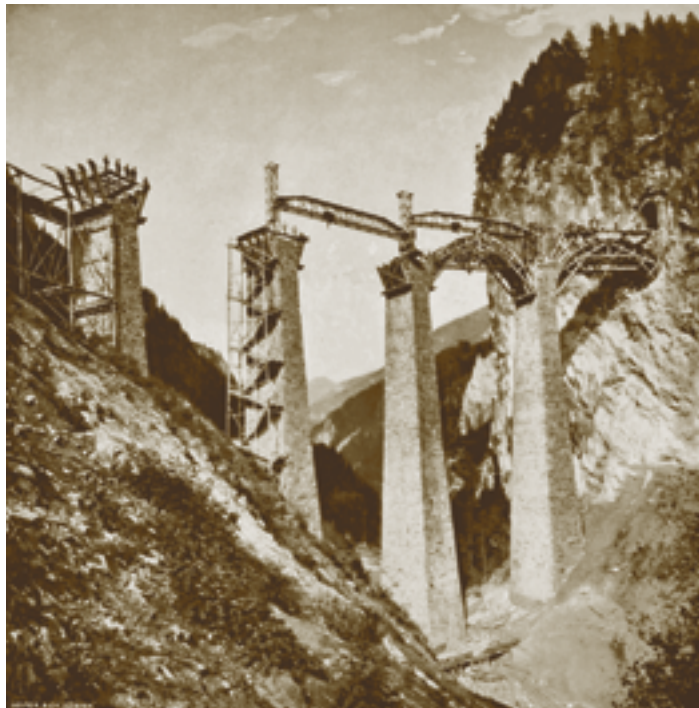
Landwasserviadukt bei Filisur im Bau, 1902